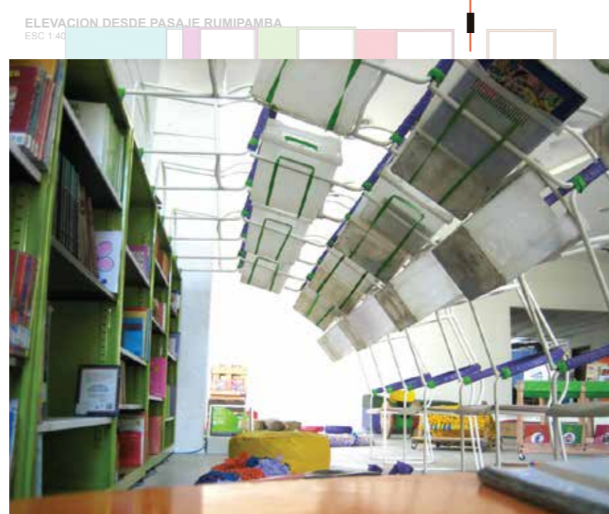
ELEVACION DESDE PASAJE RUMIPAMBA ESC 1:40